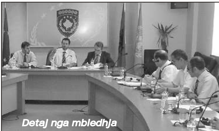
Detaj nga mbledhja

Punën e mëtejme të këtij Këshilli duhet orientuar kah parimet e reja të Konventës mbi të drejtat e personave me aftësi të kufizuara për t'i dhënë dimenzionin real për përgaditjen e kushteve për implementimin e saj në Kosovë.