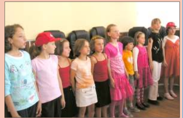
Kuvendi i fëmijëve në Mitrovicë

Donatorë të këtij manifestimi tradicional ishin Zyra Amerikane, OSBE-ja, ndërsa organizator, partnerët e OJQ-ve që mbështesin Programin DMD me përkrahje të Ministrisë së Shëndetësisë, OJQ Little People of Kosovo dhe OJQ Hendifer Ferizaj.